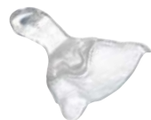
Individuelle Löffel Material: IMPRELON® (klar oder opak)