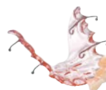
Plattenprovisorien Material: BIOCRYL® C (rosa-transparent)