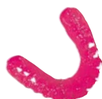
Indikatorschienen Material: BRUX CHECKER® (rot oder weiß)