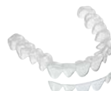
Bleichschienen Material: COPYPLAST® oder BIOPLAST® bleach