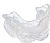
Positioner Material: BIOPLAST® (transparent)