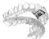
TAP® Schienen Material: DURASOFT® pd 2,5 mm

Beste Ergebnisse für unterschiedlichste Indikationen: