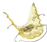
KFO Dehn- und Retentionsplatten Material: BIOCRYL® C