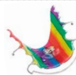
KFO Dehn- und Retentionsplatten Material: BIOCRYL® M (mehrfarbig)