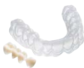
Gießmasken für Provisorien Material: COPYPLAST®