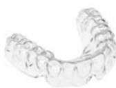
OSAMU-Retainer® Material: IMPRELON® S pd BIOPLAST®