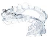
IST®-Gerät Material: DURAN®